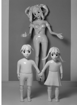
Kim Simonsson: Supersankari I, 2002. Karttuna kokoelma.