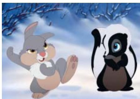
BAMBI 2 ON PIKKUKOULULAISILLE

Animaatio. Puhuttu suomeksi / tekstitetty ruotsiksi. Kesto 74 min, S.