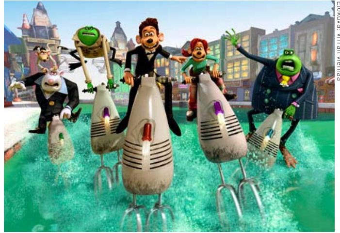
Elokuvan: Virran viemää