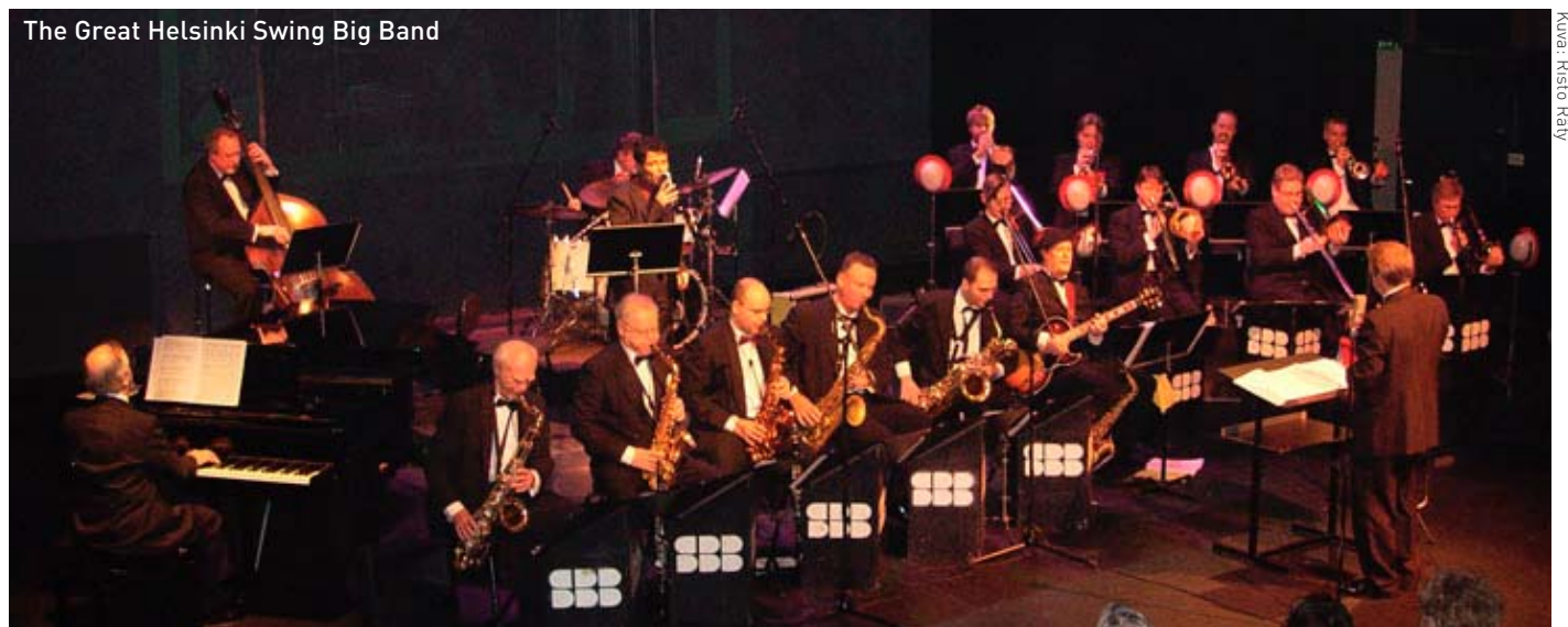
The Great Helsinki Swing Big Band