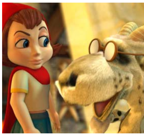
Talvilomaleffoja! s. 8