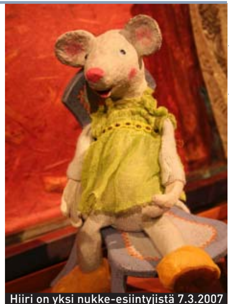
Hiiri on yksi nukke-esiintyjistä 7.3.2007

Ke 7.3. klo 10 Nukketeatteri Sampo: Musiikkia matkalaukussa Kesto 40 min. Liput 7/6 e . Varaukset p. (09) 323 6968, ntsampo@ntsampo.fi Järj. Nukketeatteri Sampo