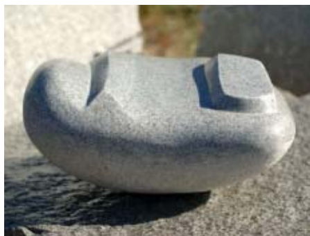
Teos/kuva: Tapio Korhonen