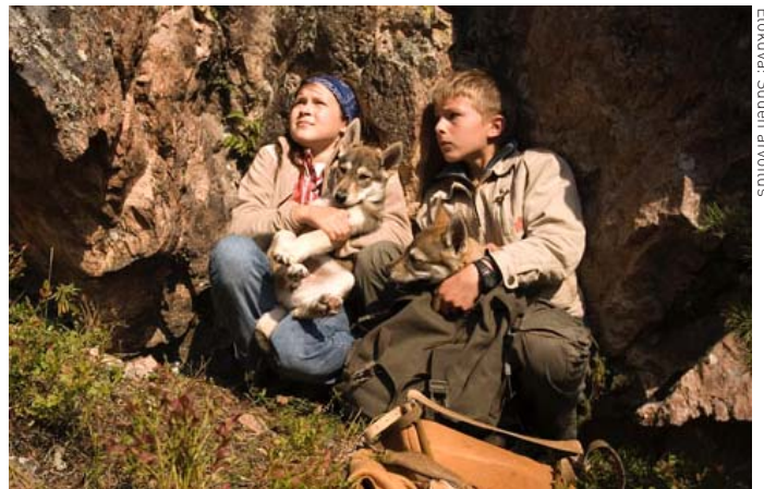
Elokuvan: Suden arvoitus

Ohjaus Raimo O Niemi (Suomi 2006). Pääosissa Tiia Talvisara, Janne Saksela, Vuokko Hovatta, Miia Nuutila, Kari-Pekka Toivonen, Peter Franzén. Kesto 97 min. Ikäraja K7/5. Liput 5 e.