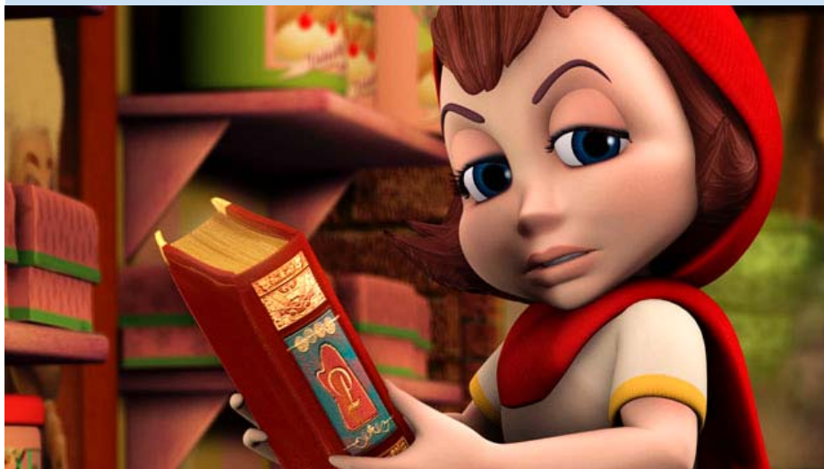
TAPAUS PUNAHILKKA TORSTAINA – EI PIKKULAPSILLE!

ritarin aaveen ja 10 000 voltin haamun mysteerimasiinan avulla uudelleen eloon.