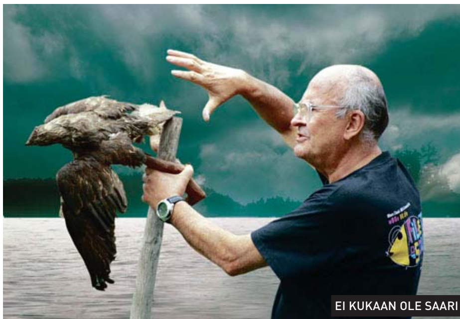
EI KUKAAN OLE SAARI