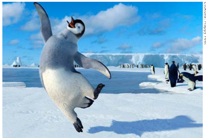
Elokuvan: Happy Feet

Ohjaus George Miller (USA 2006). Ääninä Elijah Wood, Robin Williams, Brittany Murphy, Hugh Jackman, Nicole Kidman. Kesto 111 min. Ikäraja K7/5. Liput 5 e.