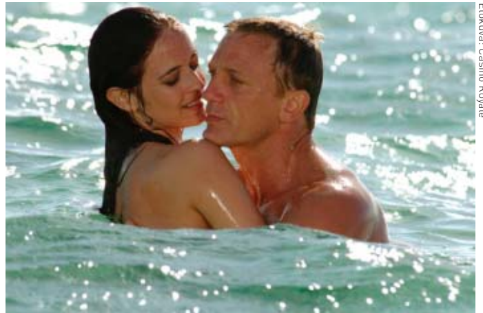
Elokuvan: Casino Royale

Ohjaus Martin Campbell (USA/Britannia 2006). Pääosissa Daniel Craig, Judi Dench, Mads Mikkelsen, Eva Green, Caterina Murino. Kesto 147 min. Ikäraja K15. Liput 6 e.